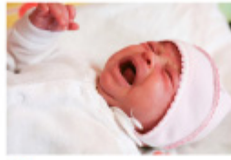
Common symptoms Cough, shortness of breath, decreased feeding, irritability, high fever