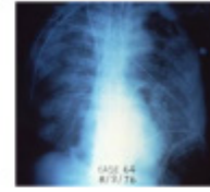
A severe, often lethal form of pneumonia (lung infection)