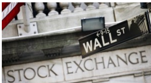
Wall Street, donde abundan psicópatas

Según Robert Hare, la sociedad no puede defenderse de los psicópatas porque son ellos los que hacen las reglas. “Los psicópatas no son solo los fríos asesinos de las películas. Están en todas partes, viven entre nosotros y tienen formas mucho más sutiles de hacer daño que las meramente físicas. Los peores, llevan ropa de marca y ocupan suntuosos despachos, en la política y las finanzas. La sociedad no les ve, o no quiere verles, y consiente” ( Nieves, 2007 ). Cifra los psicópatas en un 1% de la población. “Ese 1% puede tener impacto sobre millones de personas. Fíjese, por ejemplo, en los grandes escándalos financieros, con pérdidas para miles de personas. Detrás hay una mente psicópata. En los grandes negocios la psicopatía no es una excepción. ¿Qué tipo de persona cree usted que es capaz de robar a miles de inversores, de arruinarles aunque después se suiciden? Dirán que lo sienten, pero nunca devolverán el dinero. Es incluso peor que lo que hacen muchos asesinos” ( Nieves, 2007 ).